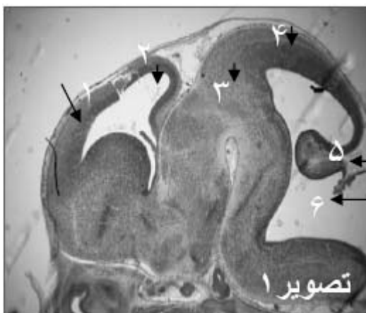
شکل ۱- فتومیکروگراف مغزدر برش طولی جنین گروه شاهد (۱- کورتکس اولیه، ۲- بطن‌های طرفی، ۳- دین سفالن، ۴- مزن سفالن، ۵- متن سفالن، ۶- بطن چهارم)

ظاهر رحم در گروه تجربی ۱ بسیار متورم و تقریباً پر خون بود و طول شاخ رحم آن نیز کاهش داشت. در حالی که در گروه تجربی ۲ در مقایسه با گروه شاهد تفاوتی نداشت. بررسی برش‌های عرضی رحم نیز موید این مشاهده بود، بطوری که ضخامت آندومتر، ضخامت جداره رحم و قطر رحم در مقایسه با گروه شاهد افزایش چشم‌گیری داشت ( p < 0.05 ). جدول ۱ خصوصیات رحم موش‌های باردار دریافت کننده آسیکلوویر در دور دهان (گروه تجربی ۱) و پوست پشت (گروه تجربی ۲) و گروه‌های شاهد آنها در روز ۱۵ بارداری را نشان می‌دهد. در گروه تجربی ۱ از سه دسته شش تایی فقط یک موش ماده تا روز ۱۵ بارداری جنین‌های خود را حفظ کرده بود که از ۸ جنین آن یک مورد اگزوسفالی و یک مورد فتق نافی در ناحیه شکمی تشکیل شده بود، در حالی که در گروه شاهد فتق نافی دیده نشد (شکل‌های ۱ تا ۳). یک مورد جنین تحلیل رفته نیز در رحم این حیوان مشاهده شد که دلیل بر متوقف شدن رشد جنین در مراحل اولیه رشد و نمو بود.