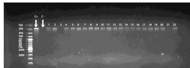
شکل ۲. تصویر ژل آگارز حاوی نمونه‌های PCR حاصل از تکثیر ژن oqxB . چاهک اول مارکر 100bp، چاهک دوم حاوی کنترل مثبت و چاهک سوم حاوی کنترل منفی. سایز باند ژن oqxB 201bp است.