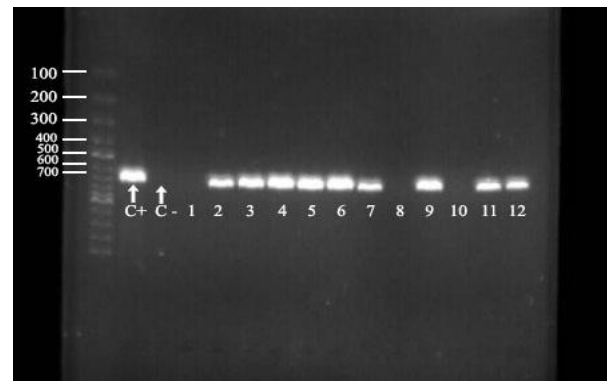
شکل ۱. تصویر ژل آگارز حاوی نمونه‌های PCR حاصل از تکثیر ژن oqxA . چاهک اول مارکر 100bp، چاهک دوم حاوی کنترل مثبت و چاهک سوم حاوی کنترل منفی. سایز باند ژن oqxA 699bp است.