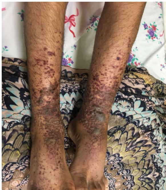
شکل ۱. وجود ضایعات پوستی بر روی اندام تحتانی دو طرف

بیمار با تشخیص شکم حاد کاندید عمل شد و پس از انجام مراقبت‌های لازم به اتاق عمل منتقل شد. تحت بیهوشی عمومی قرار گرفت و با برش میدلاین تحتانی، شکم باز شد. عمل جراحی آپاندکتومی به انجام رسید و آپاندیس ملتهب خارج شد. پس از اتمام عمل، بیمار به بخش جراحی منتقل شد و تحت مراقبت قرار گرفت. در سیر بستری، بیمار دچار ضایعات پوستی در اندام تحتانی دو طرف شد، و ادم و درد اسکروتوم طرفین نیز در بیمار وجود داشت.