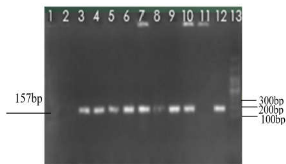
شکل ۱. نتایج حاصل از تکثیر ژن همولیزین آلفا در نمونه‌ها. چاهک ۱ کنترل منفی، چاهک ۲ و ۱۱ نمونه‌های منفی، چاهک ۳ تا ۱۰ نمونه‌های مثبت، چاهک ۱۲: کنترل مثبت و چاهک ۱۳: مارکر 100bp

توزیع فراوانی فاکتورهای ویروالانس همولیزین نیز نشان داد که همولیزین آلفا در ۹۱٪ نمونه‌ها (شکل ۱)، همولیزین بتا در ۹۶٪ نمونه‌ها (شکل ۲) و همولیزین دلتا در ۹۹٪ نمونه‌ها (شکل ۳) مثبت بودند.