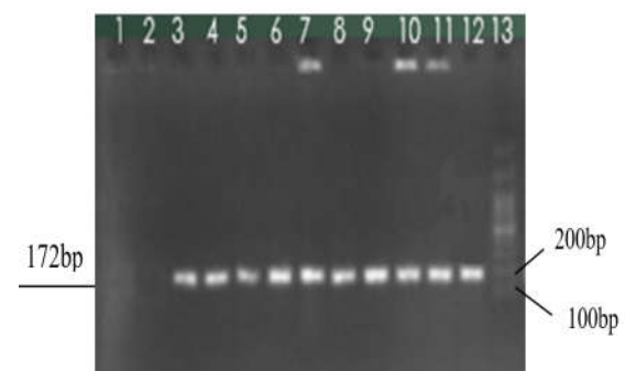
شکل ۳. نتایج حاصل از تکثیر ژن همولیزین دلتا در نمونه‌ها. چاهک ۱: کنترل منفی، چاهک ۲: کنترل منفی، چاهک ۳-۱۲: نمونه‌های مثبت، چاهک ۱۳ مارکر 100bp