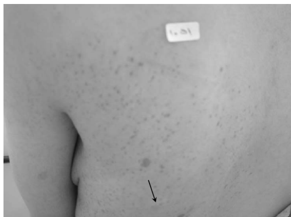
شکل ۲- ضایعات شیر-قهوه و فرکل و یک ضایعه نوروفیبروما (فلش) در قسمت خلفی نیمه چپ تنه