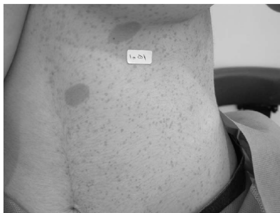
شکل ۱- ضایعات شیر-قهوه و فرکل در نیمه قدامی و چپ تنه

بیمار دوم: خانم ۲۰ ساله‌ای جهت درمان ضایعات ماکولر و patchy پیگمانته در ناحیه بازو، ساعد، پستان و زیرپستان سمت راست مراجعه کرده بود (شکل‌های ۵ و ۶).