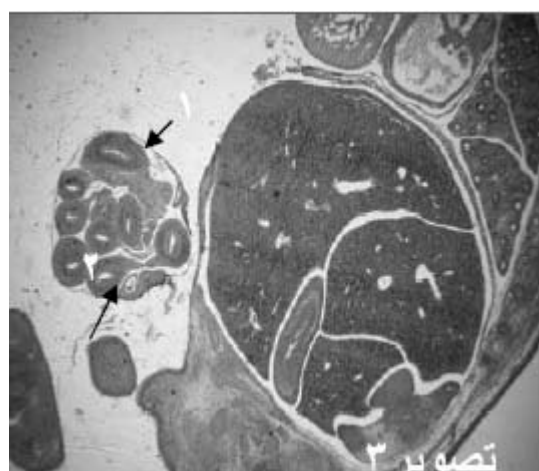
شکل ۳- فتومیکروگراف سطح شکمی جنین در گروه تجربی ۱ (۱- فتق نافی، ۲- لوپ های روده)