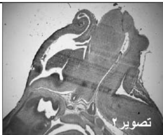
شکل ۲- فتومیکروگراف مغزدر برش طولی جنین گروه تجربی ۱

آسیکلوویر از جفت عبور می‌کند و به جنین می‌رسد (۲۳) و توان تراژونیک دارد و بیشتر بی‌نظمی‌های کلی ساختاری، مربوط به جمجمه و دم است (۲۱). ما نیز به یک مورد جنین در حال تحلیل در رحم که دلیل بر متوقف شدن رشدونمو در مراحل اولیه جنینی و یک مورد اگزینسفالیه که دارای فتق نافی نیز بود، از کل ۸ جنین بدست آمده از گروه تجربی ۱ برخورد کردیم. این مطالعه نشان داد که اگر آسیکلوویر موضعی از طریق لیسیدن وارد بدن شود، مانعی برای رشد و نمو طبیعی جنین خواهد بود و احتمالاً باعث سقط جنین می‌شود، در حالی که مصرف آن در قسمت‌های دیگر پوست (به غیر از اطراف دهان) مشکلی بوجود نمی‌آورد و جنین‌ها بدون ناهنجاری به رشد و نمو خود ادامه می‌دهند. بیا توجه به یافته‌های این مطالعه توصیه می‌شود مادران باردار مبتلا به تبخال و عفونتهای مشابه ویروسی در صورت امکان در دو ماهه اول حاملگی که در طی آن جنین اندام‌زایی می‌کند، از این دارو لاقط در اطراف دهان استفاده نکنند، چون احتمال وارد شدن دارو به داخل دهان وجود دارد.