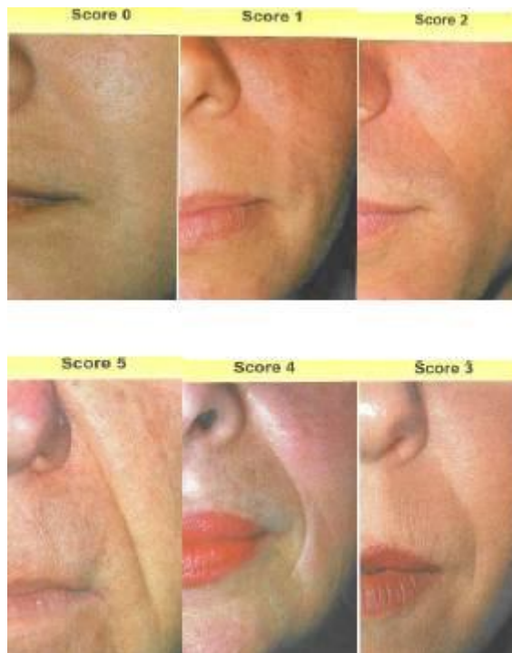
شکل ۱- درجه بندی عمق ضایعات پوستی

کلاس (۰): عدم وجود فرورفتگی، کلاس (۱): فرورفتگی قابل مشاهده، کلاس (۲): فرورفتگی سطحی، کلاس (۳): نسبتاً عمیق، کلاس (۴): فرورفتگی عمیق، کلاس (۵): فرورفتگی خیلی عمیق با کناره‌های برآمده.