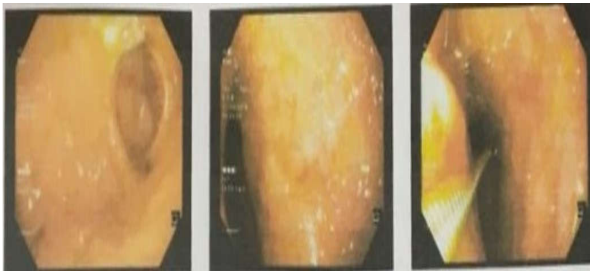
شکل ۳. وجود ضایعات اریتماتو و اروزیو در انتروئودنوم

کمتر از ۱۴ مورد در هر یک میلیون نفر گزارش شده است (۱۷).