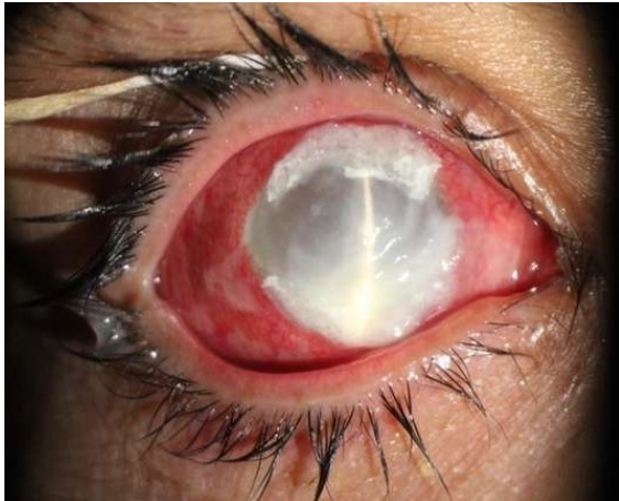
شکل ۲. پوشاندن نازکی محیط قرنیه با استفاده از چسب سیانوآکریلات

به دلیل بارداری بیمار، درمان ضد قارچ خوراکی آغاز نشد و درمان موضعی با وریکونازول ۱٪، آمفوتریسین B ۰.۱۵٪ و کلرهگزیدین ۰.۲٪ همچنان ادامه یافت و بیمار با توصیه به نیاز داشتن به پیگیری دقیق از بیمارستان مرخص شد. بعد از گذشت یک ماه از پیوند مجدد قرنیه، بیمار با عفونت شدید در بافت پیوندی، صلبیه و نایبایی کامل (عدم درک نور) ارجاع شد (شکل ۳).