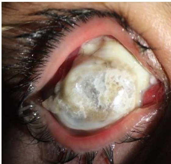
شکل ۳. عود مجدد عفونت شدید در بافت قرنیه پیوند شده و صلبیه یک ماه بعد از کراتوپلاستی درمانی بزرگ قرنیه صلبیه‌ای.

به دلیل بارداری بیمار، درمان ضد قارچ خوراکی آغاز نشد و درمان موضعی با وریکونازول ۱٪، آمفوتریسین B ۰.۱۵٪ و کلرهگزیدین ۰.۲٪ همچنان ادامه یافت و بیمار با توصیه به نیاز داشتن به پیگیری دقیق از بیمارستان مرخص شد. بعد از گذشت یک ماه از پیوند مجدد قرنیه، بیمار با عفونت شدید در بافت پیوندی، صلبیه و نایبایی کامل (عدم درک نور) ارجاع شد (شکل ۳).